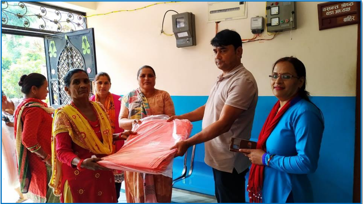
तस्वीर २५ - कृषकहरुलाई प्लाष्टिक टनेल वितरण गर्नुहुँदै बालिङ-९ वडा अध्यक्ष