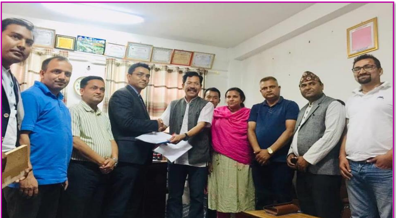
तस्वीर ४ - E-Payment को लागि नेपाल क्लियरिङ हाउस लिमिटेडसंग सम्झौता, मोबाईल एपमा Testing गरिसकिएको