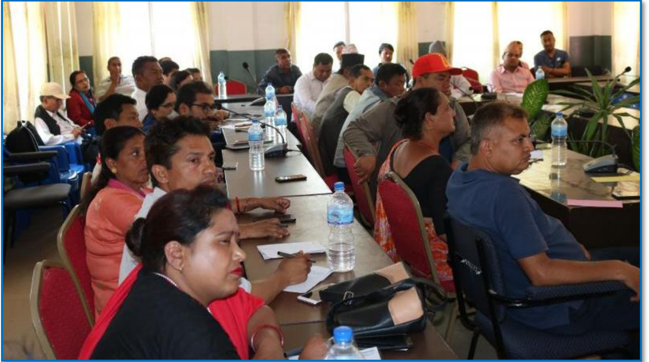
तस्वीर ३१ - वालिङको वृहत योजना निर्माणको छलफलका क्रममा उपस्थित सहभागीहरू