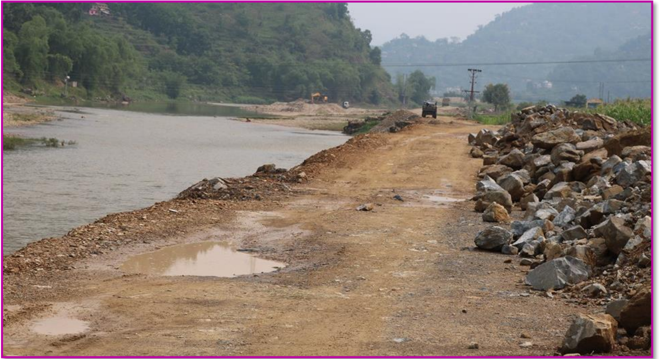
तस्वीर ७ - आँधीखोलाको दुवैतर्फ तटबन्धनका साथमा करिडोर निर्माण गरिदै