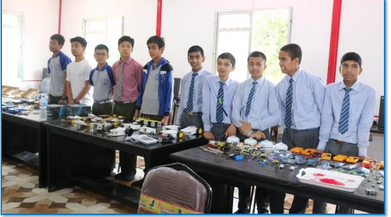
तस्वीर ३५ - इनोभेसन सेन्टरमा पढ्ने विद्यार्थीहरू एक कार्यक्रमका बीच फोटो खिचाउँदै