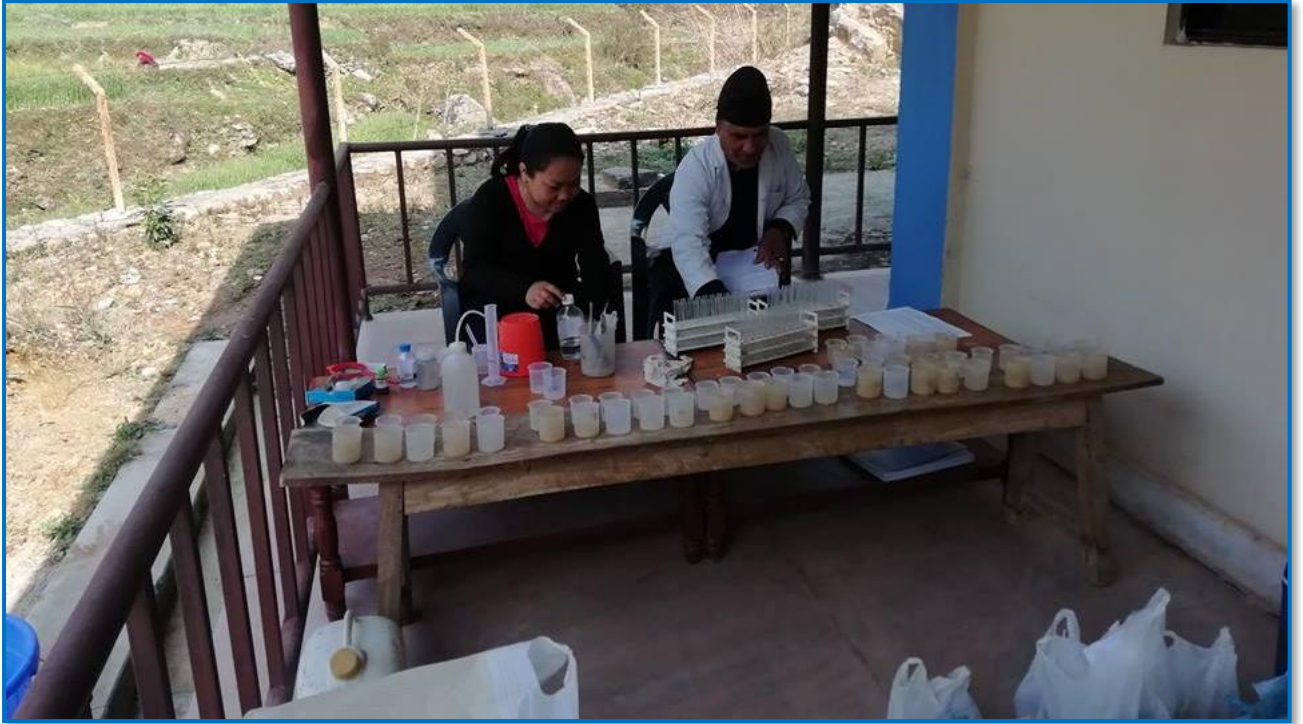
तस्वीर २३ - वालिङ २ मा घुम्ती माटो परीक्षण सेवा प्रदान गरिदै