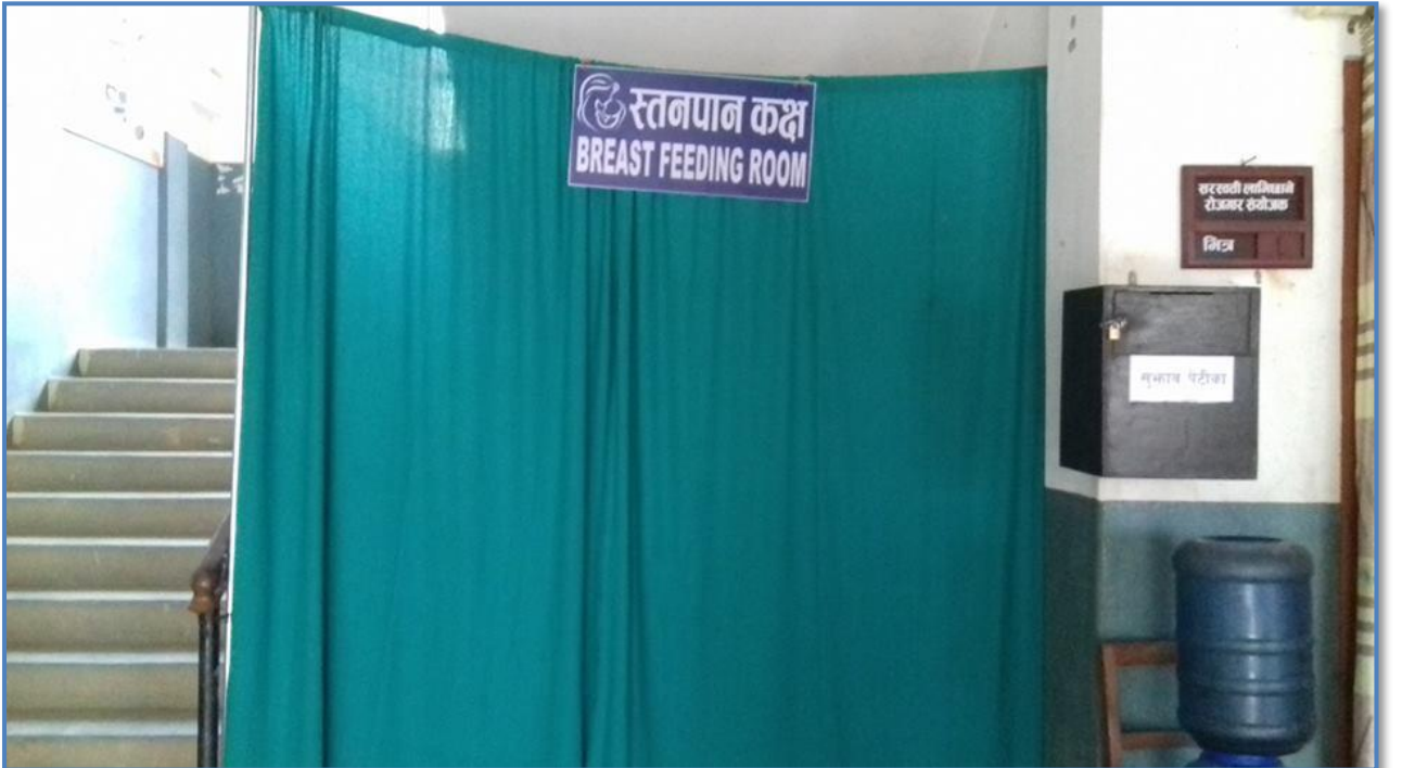
तस्वीर १६ - नगरपालिका कार्यालयभित्र स्तनपान कक्ष स्थापना