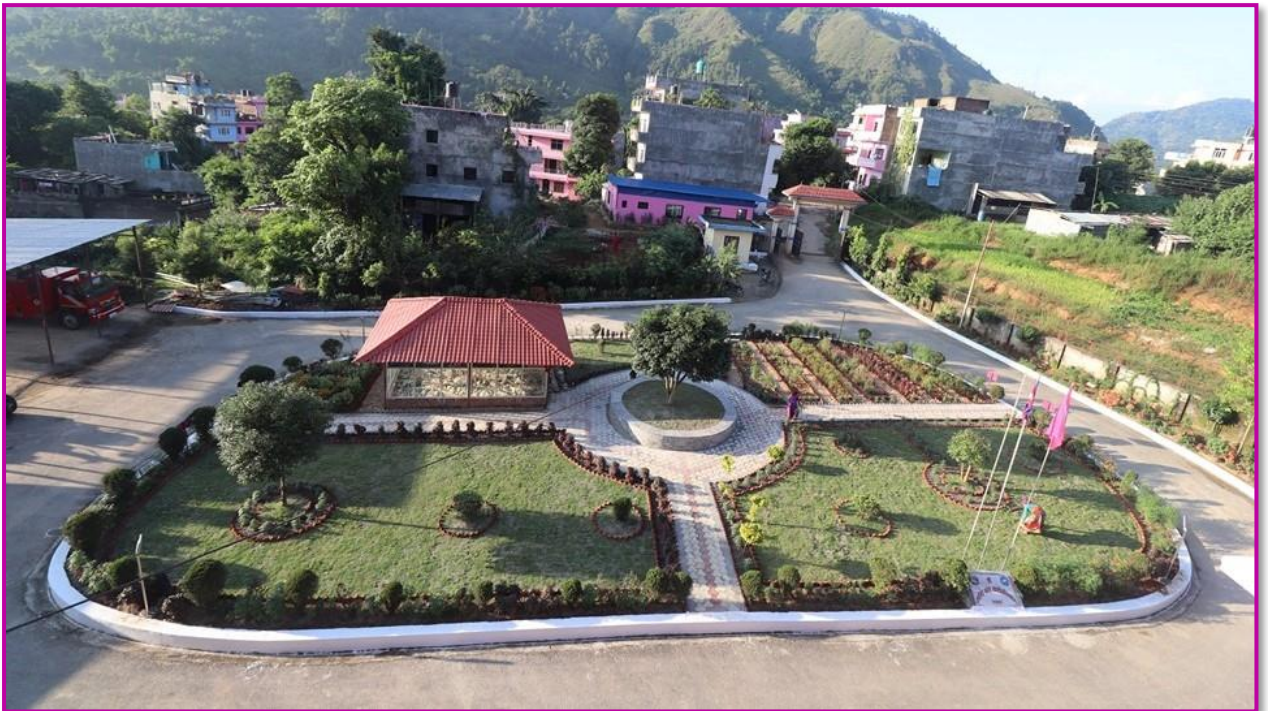
तस्बीर २ - कार्यालय अगाडि रहेको बगैँचा