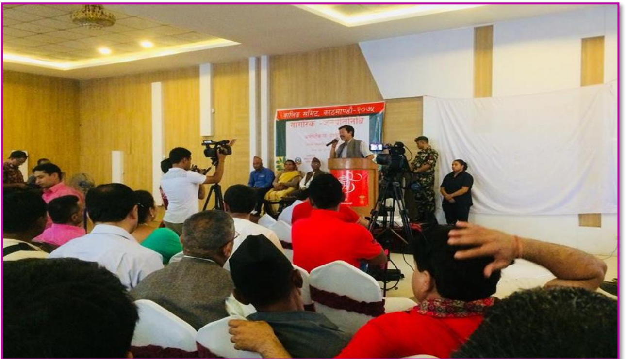
तस्वीर ६ - वालिडको समग्र विकासको लागि वालिड समिट २०७५, मिति २०७५ भदौ २३ गते काठमाडौं