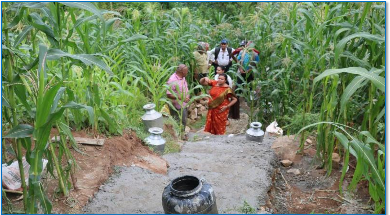
तस्वीर १८ - प्रधानमन्त्री रोजगार कार्यक्रम अन्तर्गत सिँढी बाटो निर्माणकार्यको अनुगमन गरिदै