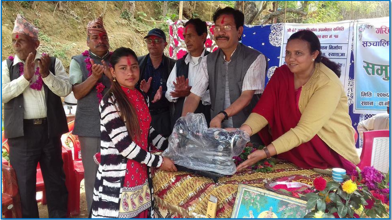
तस्वीर २९ - गरिबसंग विश्वेश्वर कार्यक्रम मार्फत् सिलाई मेसिन वितरण