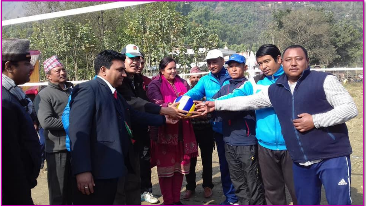
तस्वीर ९ - प्रथम मेयर कप रनिङ शिल्ड भलिबल प्रतियोगिता सुरुवात