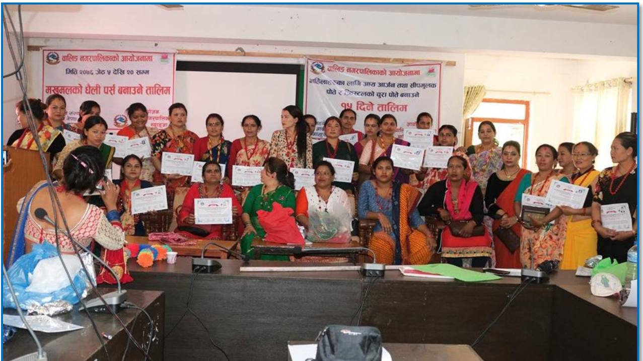
तस्वीर २८- महिलाहरूको आयआर्जन तथा सीप अभिवृद्धिको लागि मखमलको थैली/पर्स, पोते र क्रिस्टलको चुरापोते बनाउने तालिमको समापन