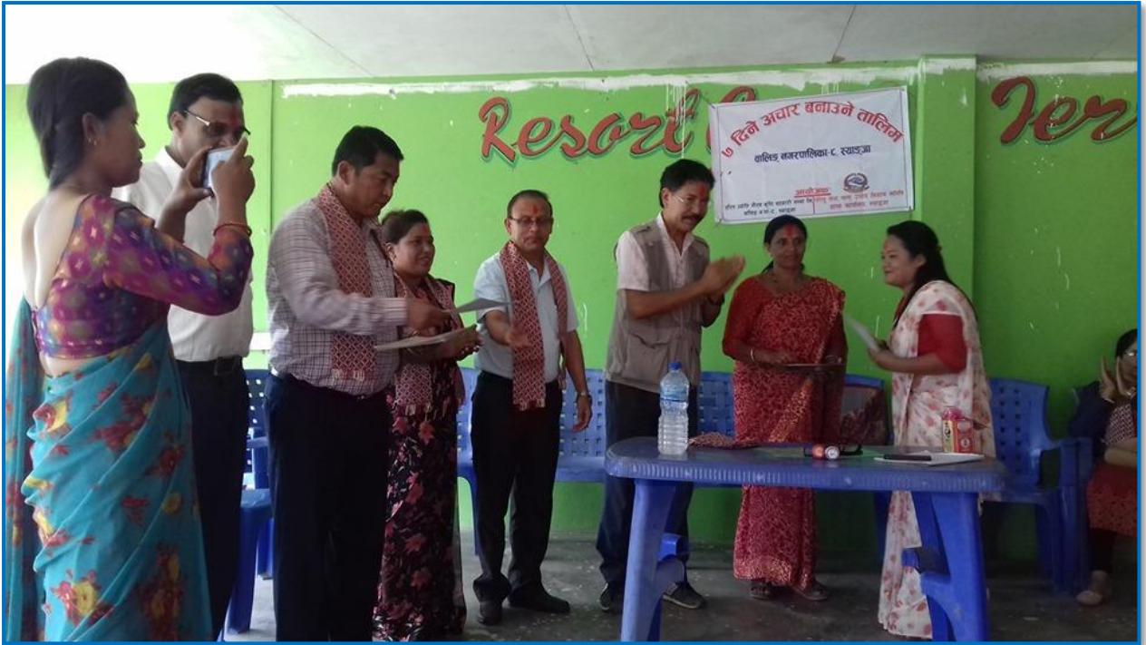
तस्वीर २७- अचार बनाउने तालिमको समापनका अवसरमा खिचिएको तस्वीर