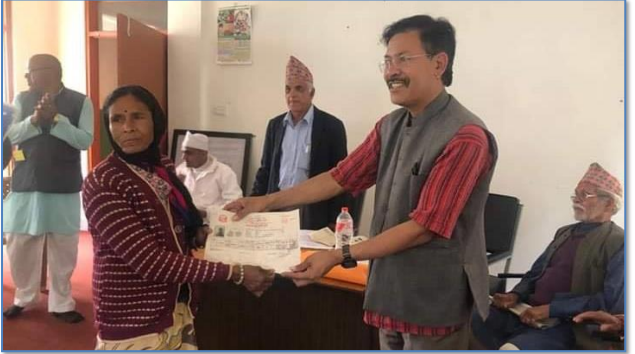
तस्वीर १५ - भूकम्प पश्चात् घरबारविहिन परिवारको लागि नयाँ घर बनाउन नियमानुसार जग्गा खरिद गरी लालपूर्जा हस्तान्तरण गरिदैँ