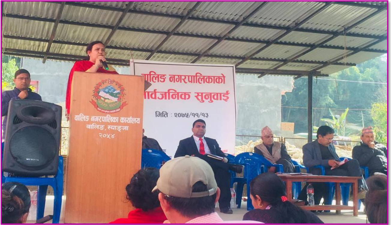
तस्वीर १४ - नगरपालिकाको सार्वजनिक सुनुवाई कार्यक्रम, २०७५ फाल्गुण १३ गते ।