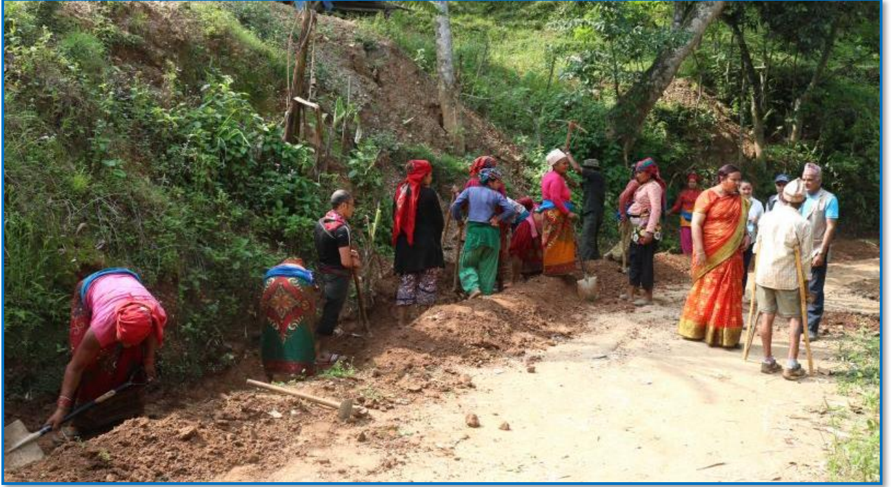
तस्वीर १७ - प्रधानमन्त्री रोजगार कार्यक्रम अन्तरगतका कार्यहरु