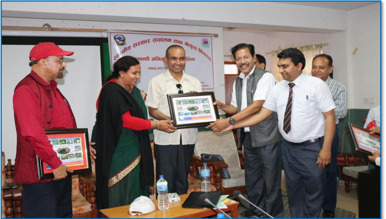
तस्वीर २० - तालिममा सहजीकरण गर्नुहुने सवैलाई मायाको चिनो हस्तान्तरण गरिदै