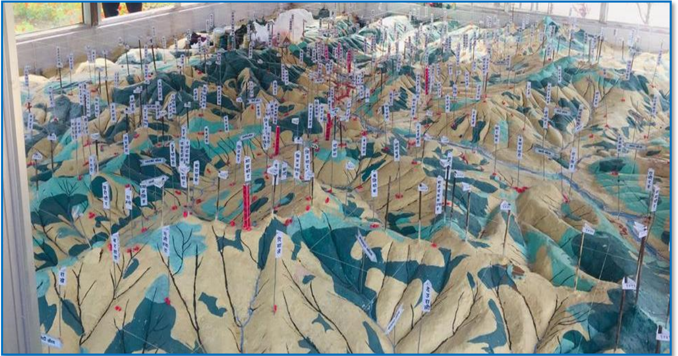
तस्वीर ३३ - नगरपालिका परिसरमा स्थापना गरिएको Topographical 3D Model