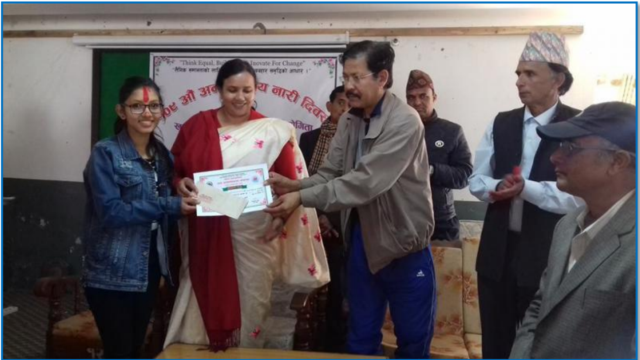
तस्वीर ३० - १०९ औं अन्तराष्ट्रिय नारी दिवसका दिन आयोजित खुल्ला वक्तृत्वकला प्रतियोगिताको विजयीलाई पुरस्कार तथा प्रमाणपत्र वितरण गरिदै