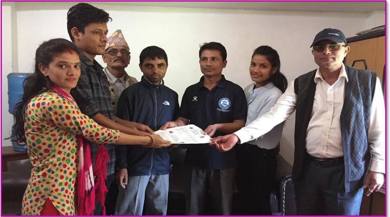
तस्वीर ५ - सम्पूर्ण वडाहरूमा अनलाईनमा आधारित व्यक्तिगत घटना दर्ता तथा सामाजिक सुरक्षा व्यवस्थापन प्रणाली लागू भएको, वडा नं. १३ को कार्यालयबाट घटनादर्ता प्रमाणपत्र हस्तान्तरण गरिदै