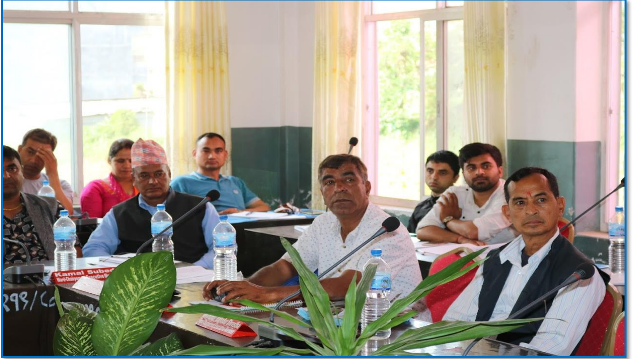
तस्वीर १९ - स्थानीय सरकार सञ्चालन तथा क्षमता विकास सम्बन्धी तालिमका सहभागीहरु