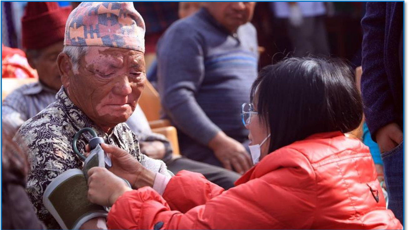
तस्वीर २२ - वृहत निःशुल्क स्वास्थ्य शिविर तथा सचेतना कार्यक्रममा विरामीको चेकजाँच गर्दै, वालिङ ३ माझकोट, मिति २०७५/८/१६