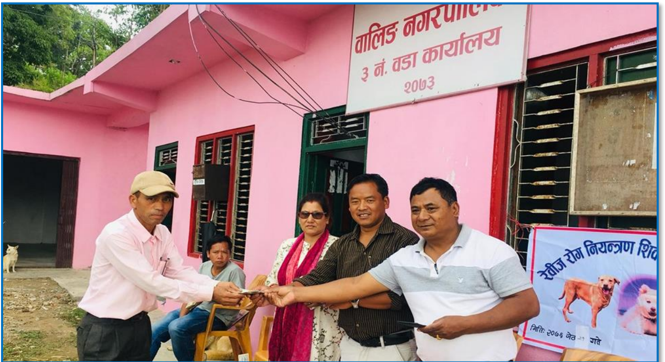
तस्वीर २४ - रेविज रोग नियन्त्रण शिविर कार्यक्रमका बीच पशुपालनको लागि अनुदान प्रदान गरिदै ।