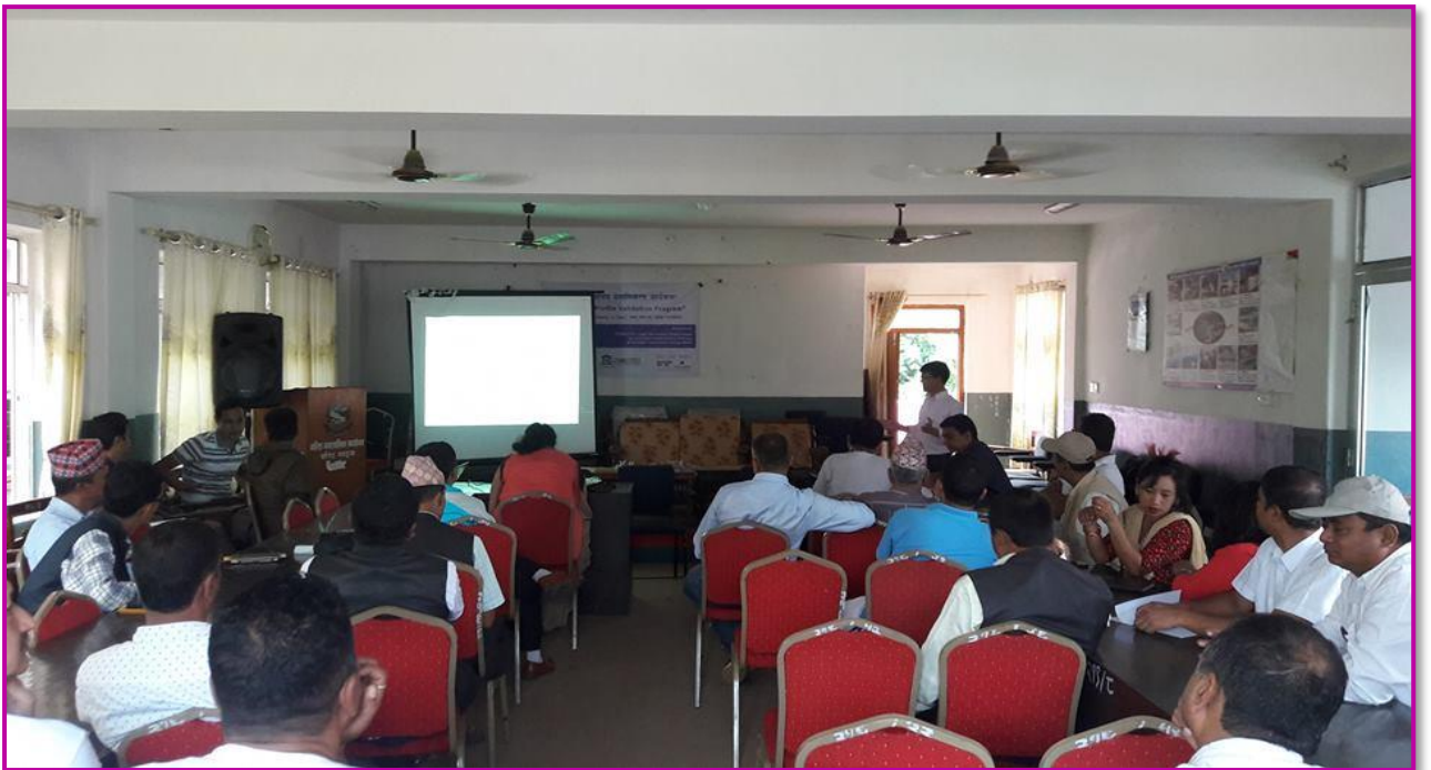
तस्वीर १२ - नगरपालिकाको पाश्चित्र प्रमाणीकरण चरणको एक झलक