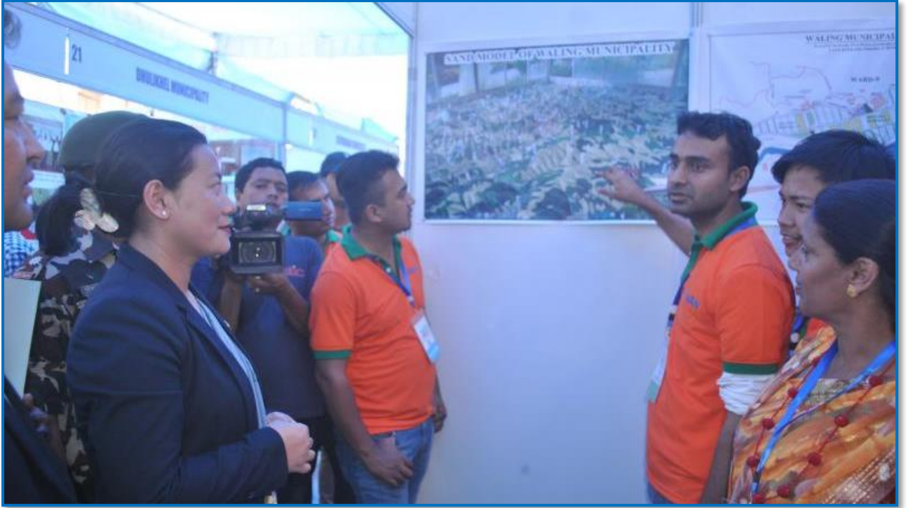
तस्वीर २१ - खानेपानी, सरसफाई तथा स्वच्छता सम्बन्धी WASH मेला मा नगरपालिकाहरूमध्येबाट वालिङ नगरपालिकाको सहभागिता