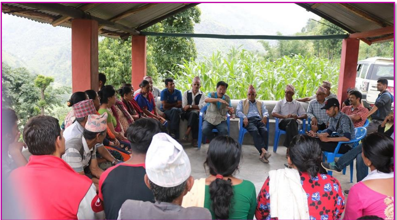
तस्वीर १० - विकासका गतिविधिहरू बुझ्न तथा बुझाउनको लागि नगरप्रमुख घरदैलोमा