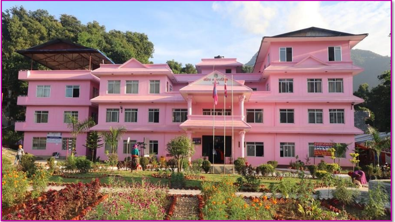
तस्बीर १ - सम्पूर्ण शाखाहरुको कार्यहरु सञ्चालन हुने गरी व्यवस्थित नगर कार्यपालिकाको कार्यालय