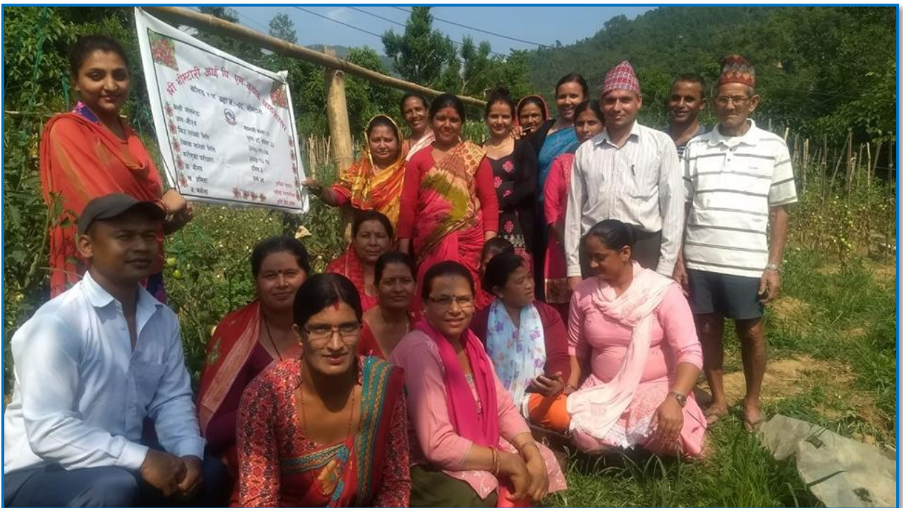
तस्वीर २६ - आईपिएम पाठशालाको अनुगमन गर्दै नगर उपप्रमुख र कृषि शाखाका कर्मचारी