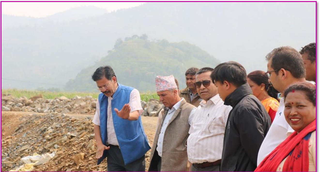
तस्वीर ८ - नगर प्रमुख, वडा अध्यक्ष, कार्यपालिका सदस्य तथा प्राविधिक कर्मचारीहद्वारा आँधीखोला करिडोर निर्माणकार्यको निरीक्षण